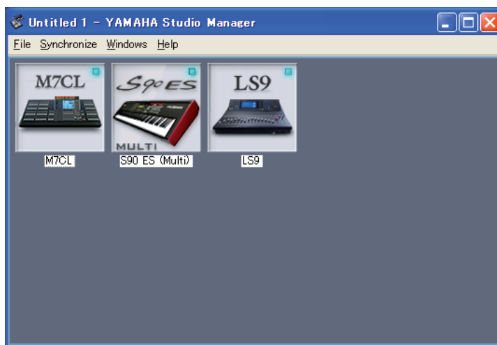
Окно Studio Manager

Щелкните на значке соответствующего редактора в окне Studio Manager.