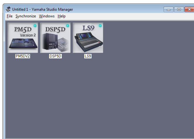
Fenêtre Studio Manager

Dans la fenêtre Studio Manager, double-cliquez sur l'icône de chaque application Editor.