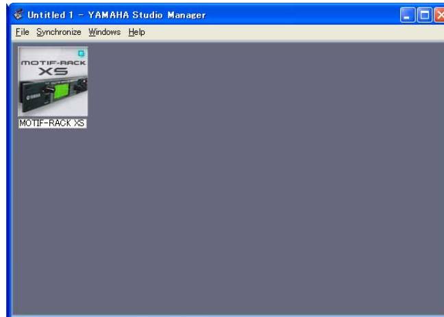
Fenêtre Studio Manager

Dans la fenêtre Studio Manager, double-cliquez sur l'icône du MOTIF-RACK XS Editor.